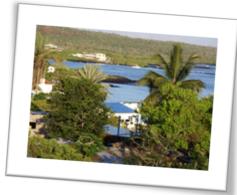
Your hotel in Santa Cruz

Er zijn diverse mogelijkheden en locaties om te duiken en dit zal ook mede afhankelijk zijn van het aantal beschikbare dagen. Echter om een beeld te geven van de mogelijkheden en de kosten geven we hier twee mogelijkheden voor enkel de duiktrips.